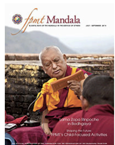
Portada del Mandala Julio-Septiembre 2014: Lama Zopa Rimpoché dando la transmisión oral del Sutra del cortador Vajra en El Pico del Buitre, Rajgir, India,

Además de la edición impresa, Mandala publica on line una docena de otras historias además sigue añadiendo otras en el blog diario daily blog , que incluye las noticias de Lama Zopa Rimpoché y de la FPMT en todo el mundo.