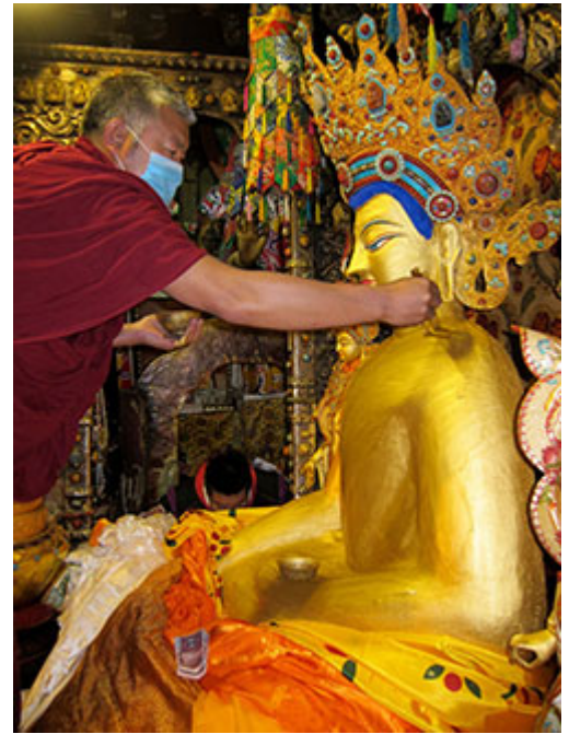
Ofreciendo oro al Buda Jowo, Lhasa, Tibet.

Podéis leer más en inglés en referencia a estos increíbles ofrecimientos, prácticas y pujas que se han hecho este año y también podéis participar ofreciendo mentalmente y dedicándolo por todas estas actividades u ofreciendo cualquier cantidad al fondo.