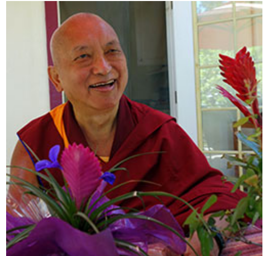
Lama Zopa Rimpoché, Aptos, US, Junio 2014.

Noviembre/Diciembre – enseñanzas durante el curso de un mes de Lamrim, Kopan Monastery , Nepal.