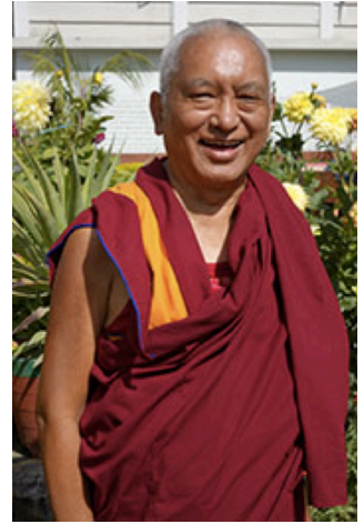
Lama Zopa Rimpoché en Samath, India, Marzo 2014.

Hemos añadido cuatro fotos de Lama Zopa Rimpoché que el mismo Rimpoché eligió hace poco para dar a los estudiantes de una selección de fotografías en alta resolución de Lama Zopa Rimpoché disponibles para que los centros, proyectos y servicios de la FPMT puedan descargárselas y usarlas.